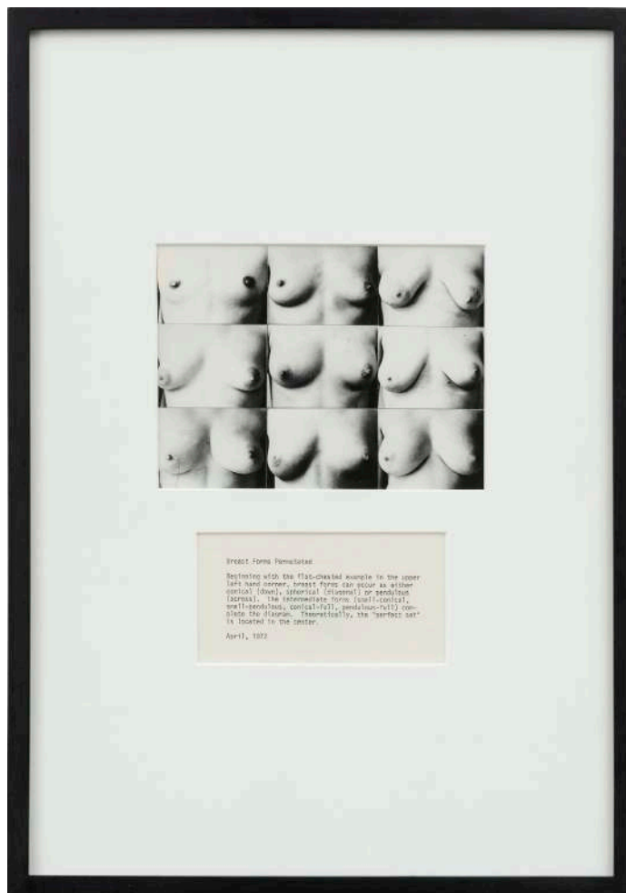
Martha Wilson Breast Forms Permutated Exemplaire numéroté et signé Photographies noir et blanc, texte 45 x 36,5 x 3 cm AP 2/3 d'une édition de 4 + 3 APs 1972/2008