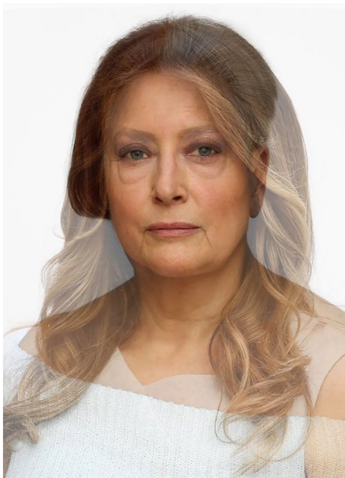
Martha Wilson Makeover: Melania Vidéo, couleurs, muet 1:00' Édition de 10 2017

ART | BASEL 12-16 JUIN | 2019 Stand E2, Hall 2.0 Edition Spotlight Unlimited