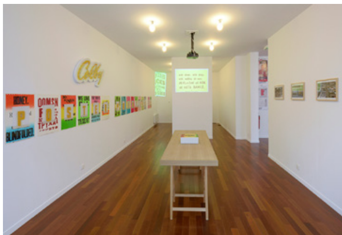
Allen Ruppersberg Colby Sign Installation constituée d'une enseigne et de 15 posters Enseigne, 55 x 90 cm Poster, 35,4 x 50 cm Édition limitée à 5 exemplaires numérotés et signés, chacun différent Chaque exemplaire est unique Produit et publié en 2014 par mfc-michèle didier ©2014 Allen Ruppersberg et mfc-michèle didier

ART | BASEL 12-16 JUIN | 2019 Stand E2, Hall 2.0 Edition Spotlight Unlimited