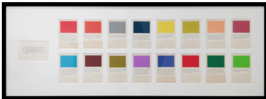
Martha Wilson Choice Art, 1972 Seize échantillons couleur avec textes dactylographiés 6,3 x 8,9 chacun

ART | BASEL 12-16 JUIN | 2019 Stand E2, Hall 2.0 Edition Spotlight Unlimited