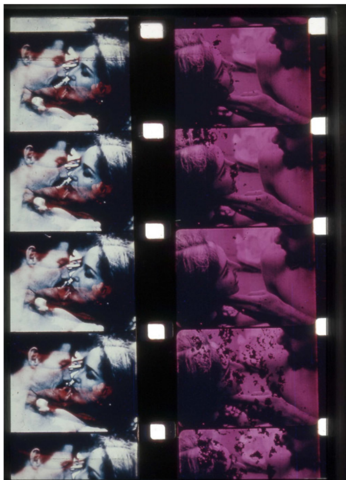
Carolee Schneemann Fuses 1965/2016 Impression sur papier 165,1 x 111,8 cm Edition #2/4

ART | BASEL 12-16 JUIN | 2019 Stand E2, Hall 2.0 Edition Spotlight Unlimited