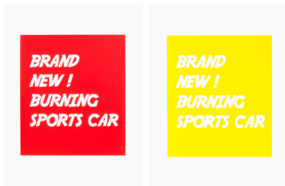
Ray Sander, affiches pour motorwork : BRAND NEW ! BURNING SPORTS CAR (rouge et jaune), 2014, sérigraphie sur papier, 49,5 x 39,8 cm chaque