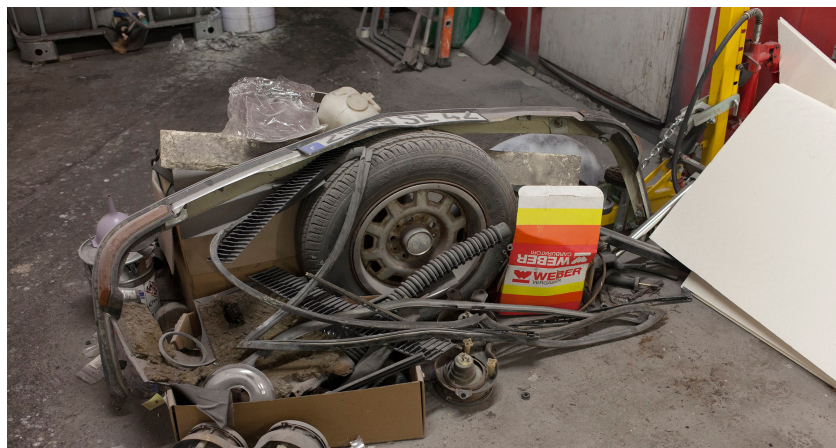
Garage Fauriel, production en cours, 2017

Le vernissage aura lieu en présence de l'artiste le jeudi 15 février 2018 de 18h à 21h.