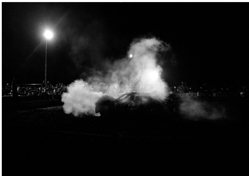
Ray Sander, SUICIDE motorwork #7 night of destruction , Irwindale speedway California, 2008