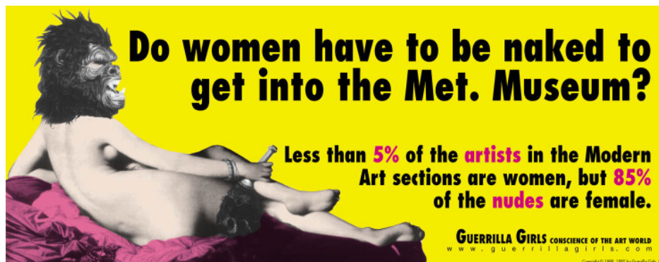
The Guerrilla Girls Do Women have to be Naked to get into the Met. Museum?