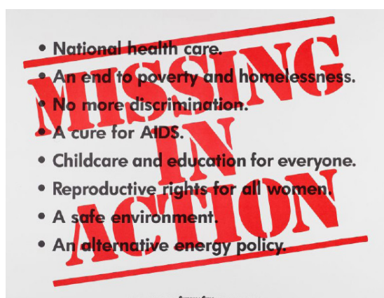
The Guerrilla Girls Missing in action