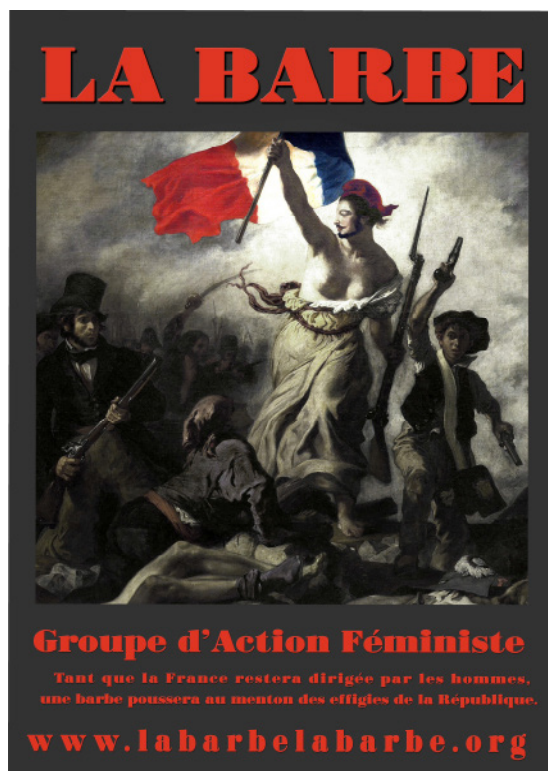
La Barbe La Barbe guidant le peuple