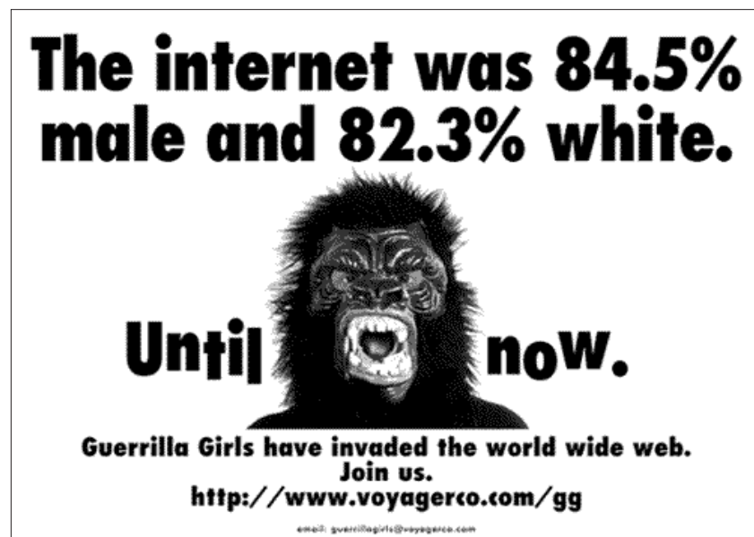
The Guerrilla Girls The internet was 84.5% male and 82.3% white. Until now.