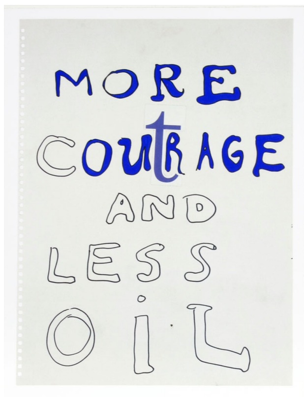
Kay Rosen More Outrage 2002 Collage - Peinture sur papier 27,9 x 21,6 cm

More Outrage (and less oil) est une annonce trouvée par Peter Cain pour une exposition à la galerie Matthew Marks en 2002. Son message était "Plus de courage et moins d'huile". Rosen a ajouté de la peinture bleue à certaines des lettres tracées et a inséré un T dans le mot COURAGE pour créer le nouveau message : More Outrage, en réponse au réchauffement climatique et à la dépendance continue à l'égard des combustibles fossiles, ce qui est encore plus urgent aujourd'hui.